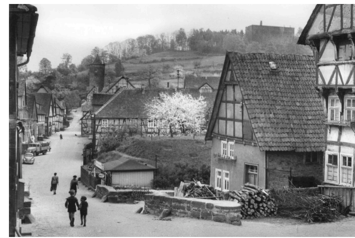
Steinweg 1959