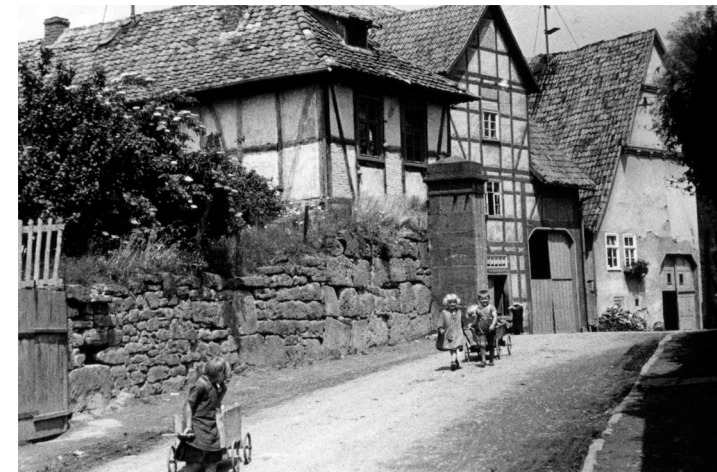
Schachter Tor um 1935