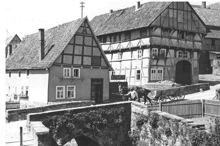
Kulturwerkstatt und Haus „Höhn“ 1940